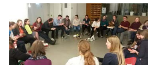
Beim Schrottwichteln wurde ausgepackt, getauscht, gelacht...

Nanu? Dieser Weihnachtsengel wurde nach dem Schrottwichteln wohl heimlich nochmal weiterverschenkt ☺