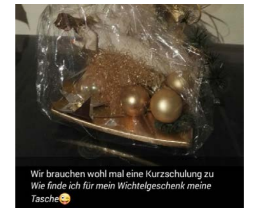
Wir brauchen wohl mal eine Kurzschulung zu Wie finde ich für mein Wichtelgeschenk meine Tasche ☺

Nanu? Dieser Weihnachtsengel wurde nach dem Schrottwichteln wohl heimlich nochmal weiterverschenkt ☺