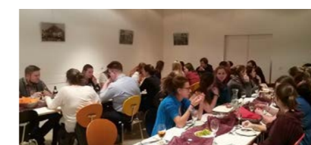
Mit knapp 30 Teilnehmerinnen und Teilnehmern war die Weihnachtsfeier so gut besucht wie nie.

Als besonderes Dankeschön für die Teamleitungen und den DAK gab es selbst gestaltete Notizhefte, um für jede Kolping-Sitzung gewappnet zu sein.