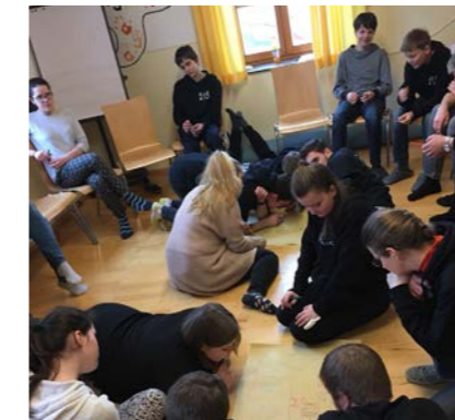
Schreibgespräche, da rauchten die Köpfe

Eine halbe Stunde Yoga am nächsten Morgen konnte alle für die nächste Einheit zum Thema „Konflikte“ motivieren. Mit Hilfe eines Schreibgesprächs wurde darauf eingegangen, was ein Konflikt ist und ab wann man bspw. bei Mobbing als Mittäter*in gilt. Im Anschluss wurde eine Übung gemacht, bei der das Verhalten von Personen in Cliquen nachgeföhlt und reflektiert werden konnte.