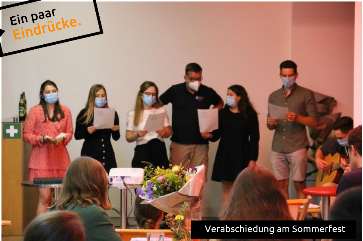
Verabschiedung am Sommerfest